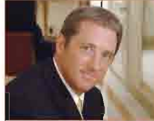
Kevin Trudeau Autor En AIM desde entonces 1998