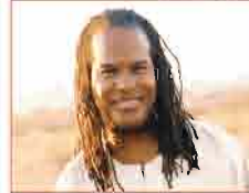
Rev. Michael Beckwith Líder Espiritual En AIM desde entonces 2000

Paso 1 Llena nuestra forma de Balanceo Energético y adjunta una de tus fotos (donde aparezcas solo, sin otras personas, animales o fotos de personas o animales dentro de ella misma, de preferencia de cuerpo completo).