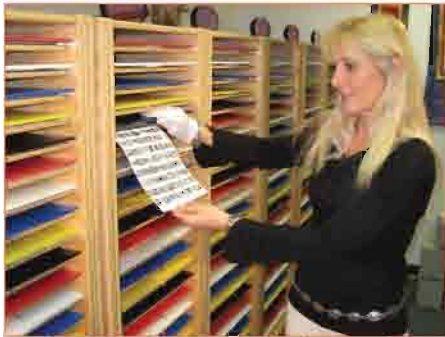
Las fotografías son digitalizadas y usadas para recibir las energías equilibrantes.

Como participante de El Programa AIM, tendrás acceso a miles de frecuencias que equilibran las 24 horas del día, 7 días de la semana.