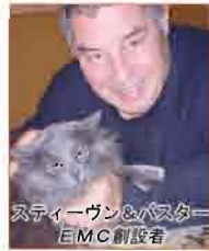
スティーヴン&パスター EMC創設者

A I Mプログラム登録料金、お支払いプラン。ファミリープランー 最高5人（親族、またはそれと同等）年間2000ドル。シングルプランー 年間1000ドル、毎月の分割払い可能（月100ドルx10回）