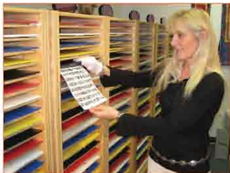
写真はデジタル化され、バランスされたエネルギーを受けとるために使われる。

A I Mの参加者になると、あなたは1日24時間、1週間に7日、何千ものバランスを保っている周波数にアクセスします。