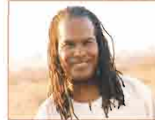
Rev. Michael Beckwith Spiritual Leader Nel AIM sin dal 2000