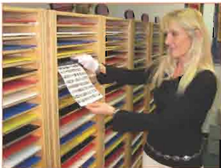
Le fotografie sono digitalizzate e utilizzate per ricevere il bilanciamento delle energie.

Come partecipante al AIM avrai a tua disposizione migliaia di frequenze 24 ore al giorno, 7 giorni alla settimana.