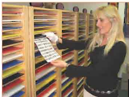
Fotographien werden digitalisiert und verwendet, um die ausgleichenden Energien zu empfangen.

Sie empfangen sofort ausgleichende Frequenzen, die Ihnen erlauben, sich selbst zu heilen. Ihr Vermittler steht Ihnen jederzeit zur Verfügung, um Fragen oder Anliegen zu beantworten, und bietet Ihnen Beratung bei Ihrem Selbstheilungsprozess an.