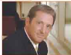
Kevin Trudeau Autor Bei AIM Seit 1998