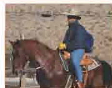
Evan & Bud EMC 2 Gründer