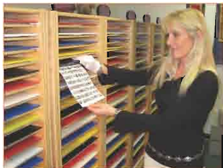
Fotos worden gedigitaliseerd en gebruikt om balancerende energie te ontvangen.

Als AIM deelnemer heeft u toegang tot duizenden balancerende frekwenties, 24 uur per dag, 7 dagen per week.